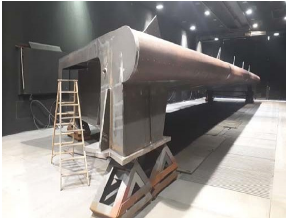
Bogenfusspunkt vor der Beschichtung